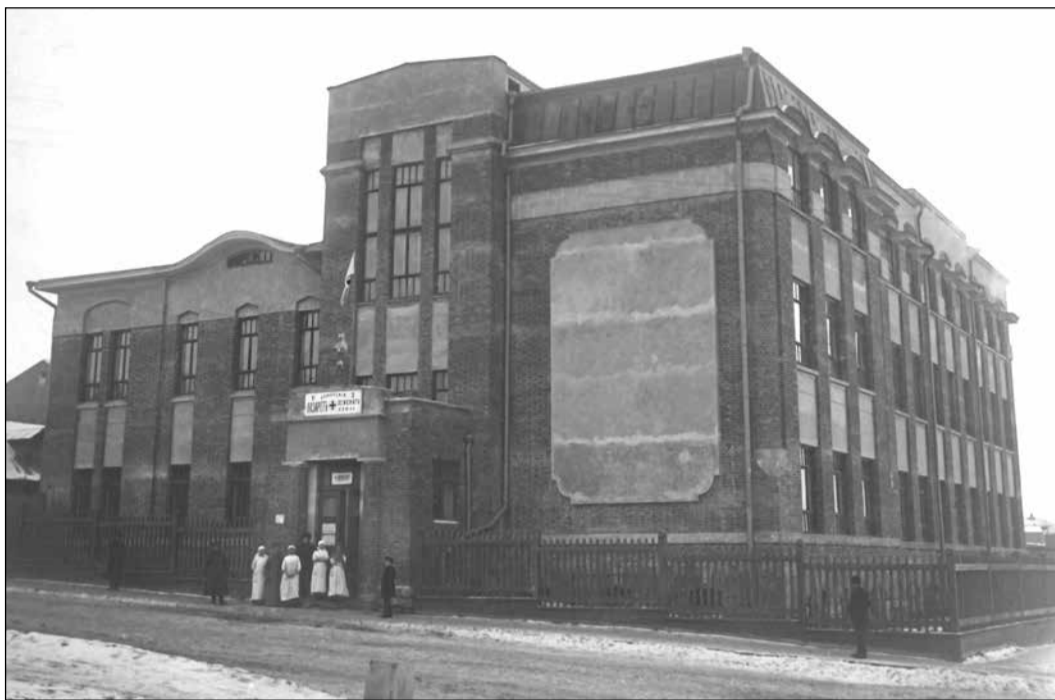
Во время Первой мировой войны в здании размещался самарский лазарет №2 Земского союза

Готовясь к 95-летию Самарского государственного медицинского университета, мы обратились в Центральный государственный архив Самарской области (ЦГАСО) с просьбой прояснить историю учебного корпуса нашего университета на ул. Чапаевской, 227