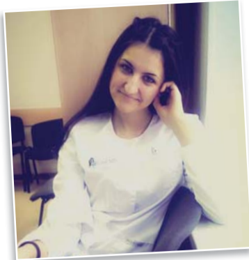
Медицина поистине есть самое благородное из всех искусств Гиппократ