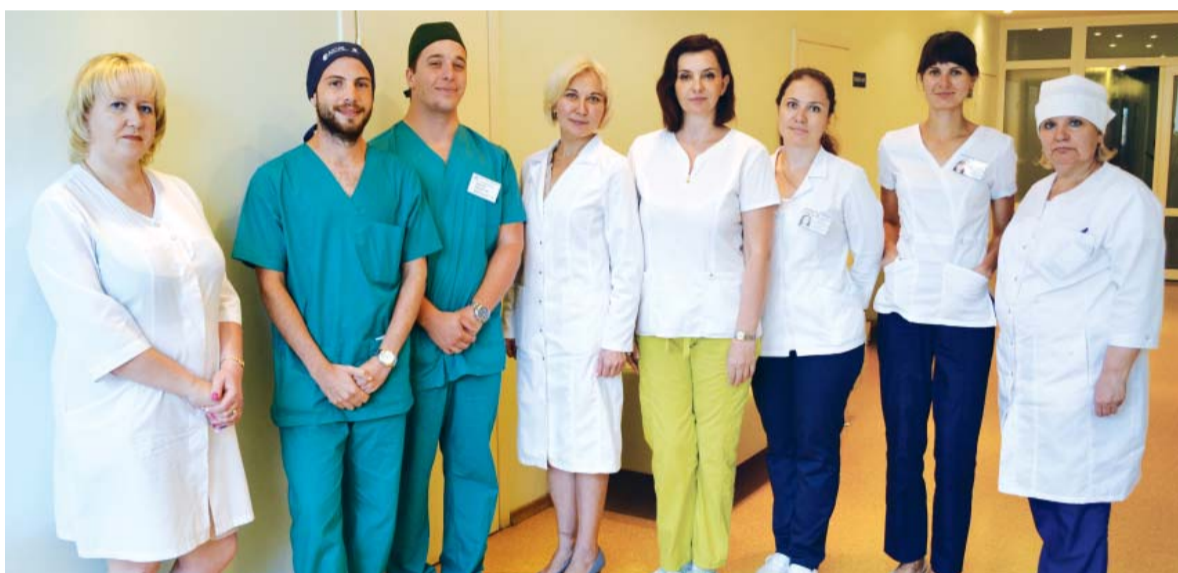
Иностранные студенты из Италии и Болгарии с сотрудниками кафедры оториноларингологии им. академика И.Б. Солдатова