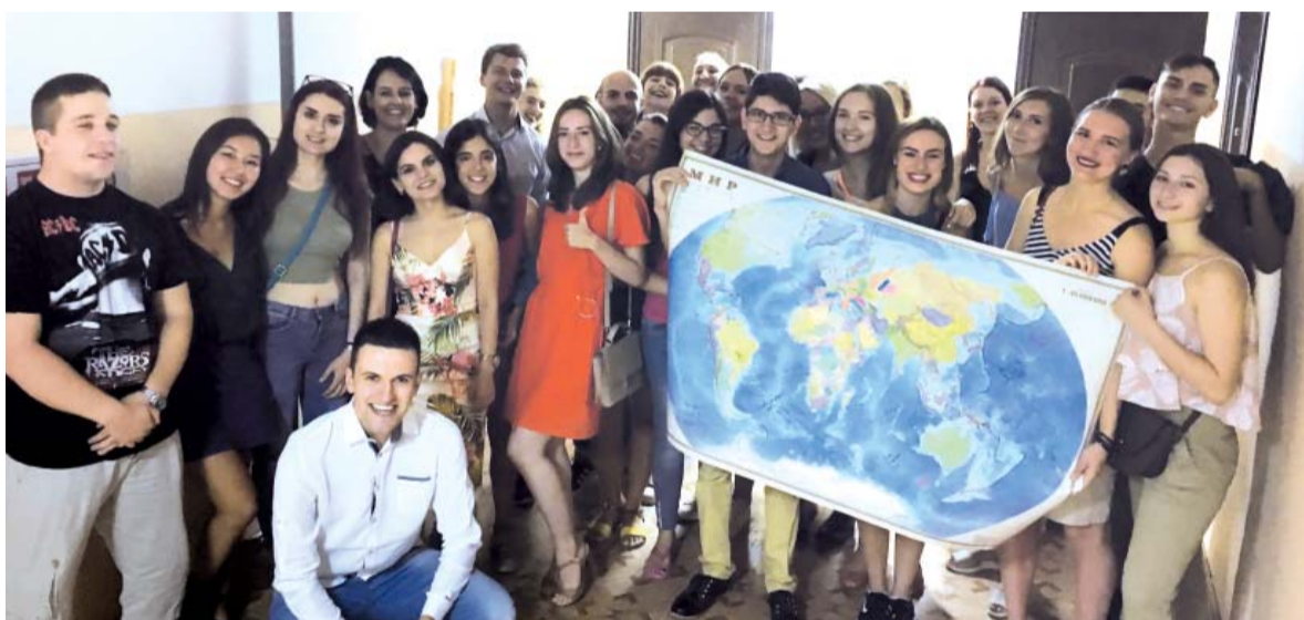
Вечер традиционной национальной кухни в общежитии №5 подарил всем хорошее настроение