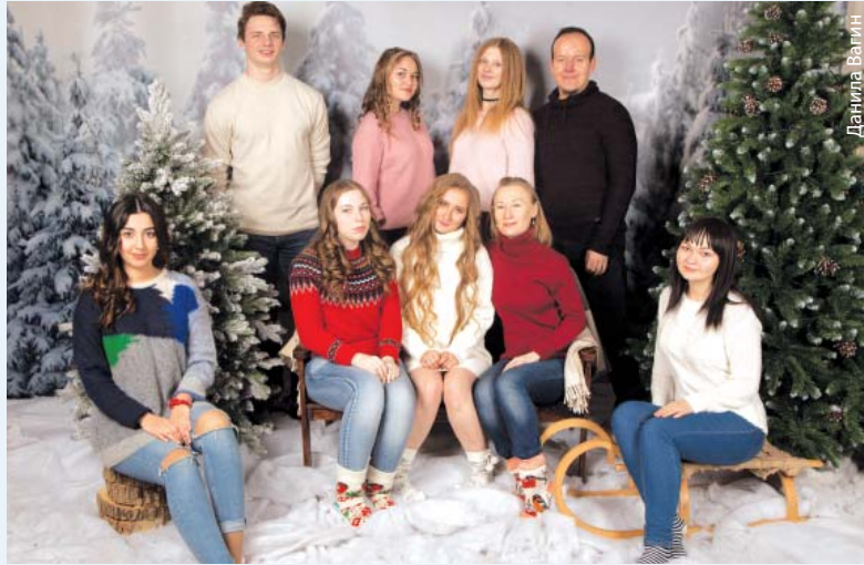
Волонтерский актив ДОМа СамГМУ

В 2018 году мы планируем развивать наши добровольческие направления и внедрять новые