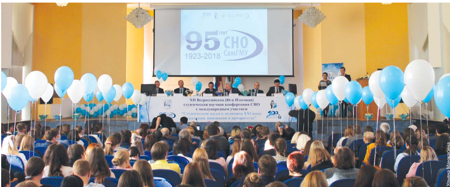
11 апреля в стенах нашей Alma mater прошла XII Всероссийская (86-я итоговая) студенческая научная конференция СНО с международным участием «Студенческая наука и медицина XXI века: традиции, инновации и приоритеты», посвященная 95-летию СНО СамГМУ.

День науки – ежегодное масштабное мероприятие, направленное на подведение итогов кропотливого и упорного труда студентов. Эта конференция ознаменовалась грандиозными цифрами: более 500 докладов, 2500 слушателей, 500 программ, 100 сборников, 25 секционных заседаний в 8 корпусах, 112 победителей, 66 кружков, 300 преподавателей. География конференции включает 24 города: Душанбе, Минск, Красноярск, Волгоград, Москву, Оренбург, Санкт-Петербург, Архангельск, Саратов, Сызрань, Казань, Петрозаводск, Уфу, Пензу, Омск, Пермь, Томск, Рязань, Киров, Челябинск, Тюмень, Кузнецк, Саратов и, конечно, Самару.