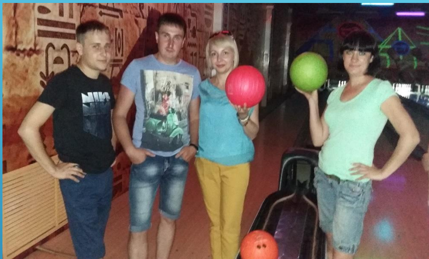
Турнир по боулингу