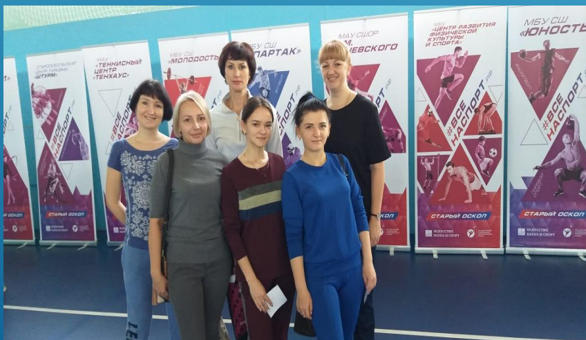
Спартакиада медицинских работников