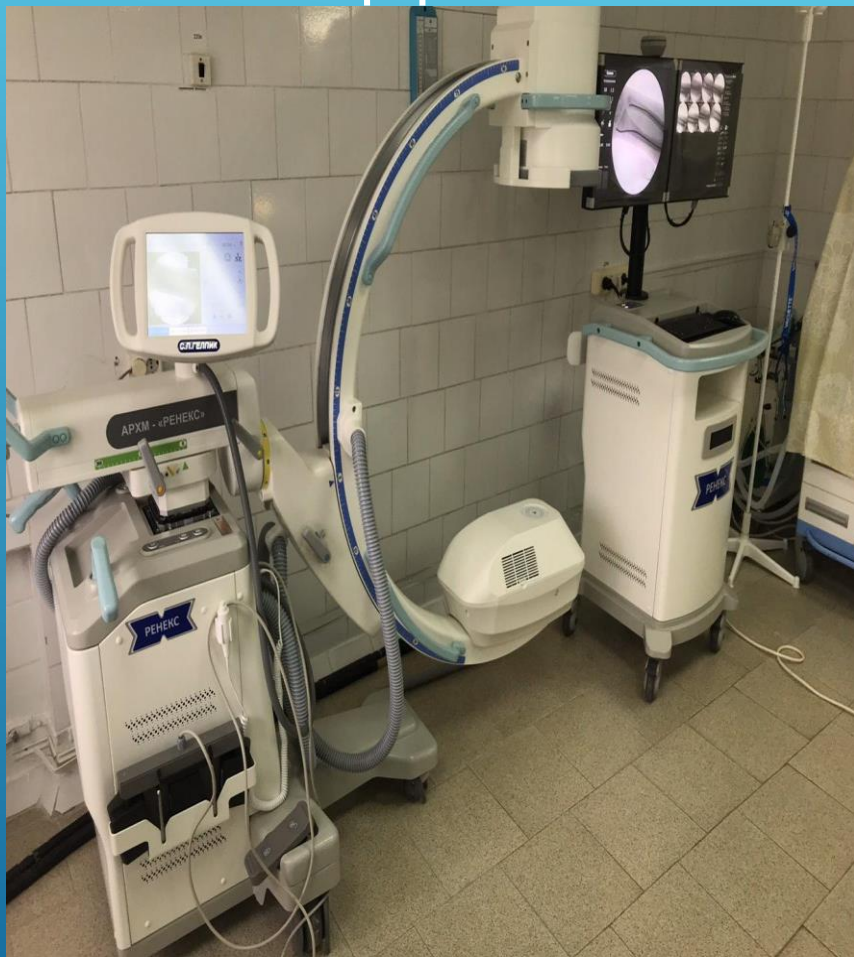
Система рентгеновская диагностическая портативная общего назначения