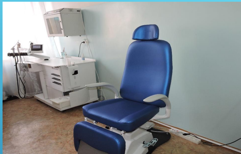
Система для ЛОР осмотра