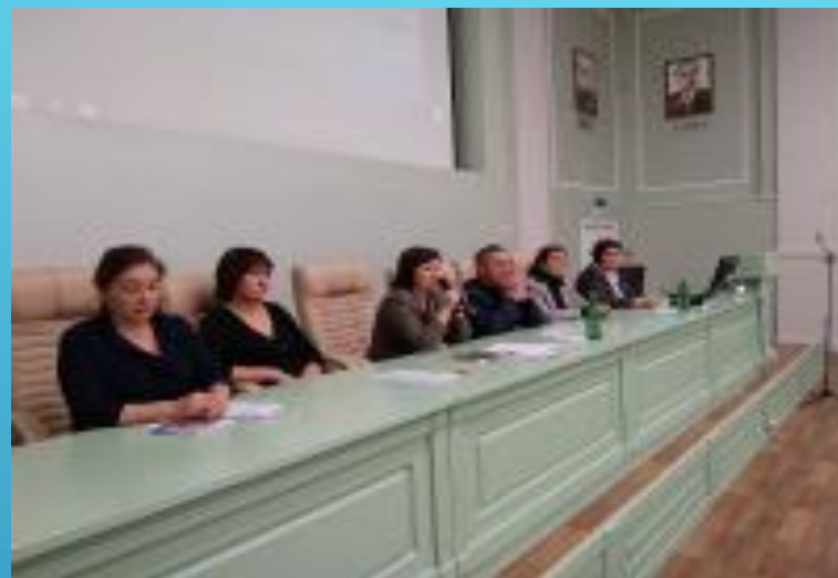
Встреча со студентами и ординаторами высших учебных заведений