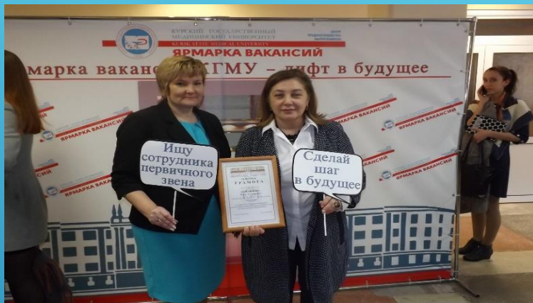
Участие в Ярмарке вакансий КГМУ