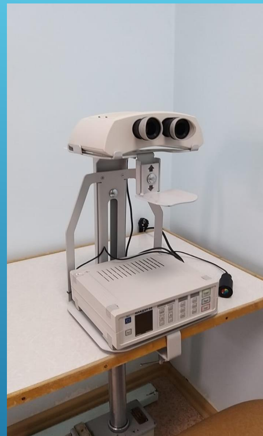
Аппарат ИК лазерный для коррекции нарушений зрения