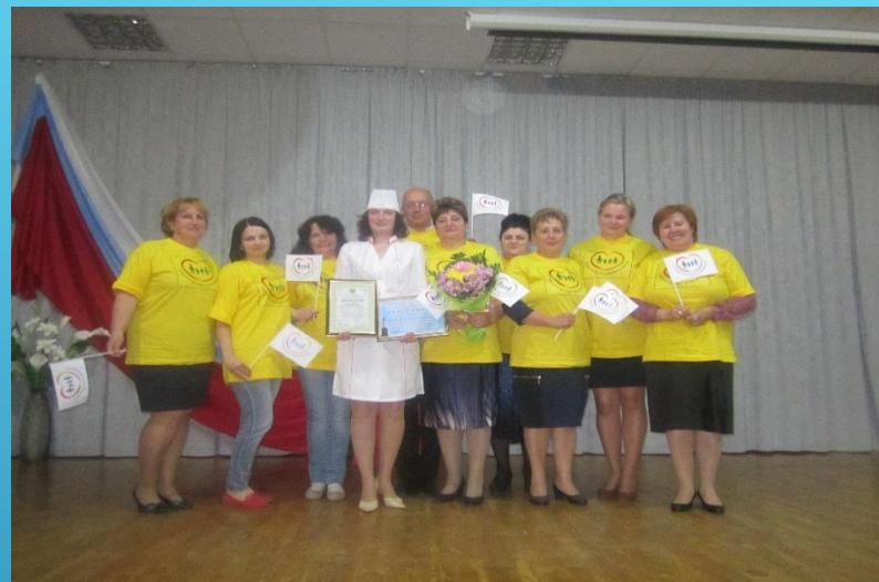
Участие в конкурсе «Лучший по профессии»