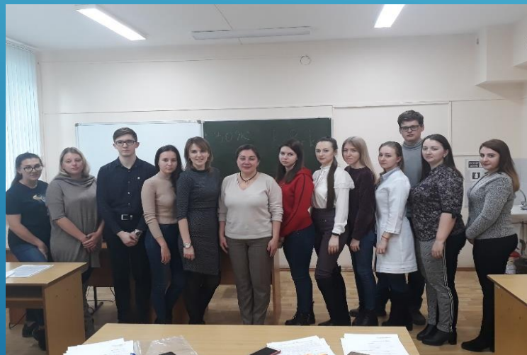
Встреча со студентами и ординаторами КГМУ