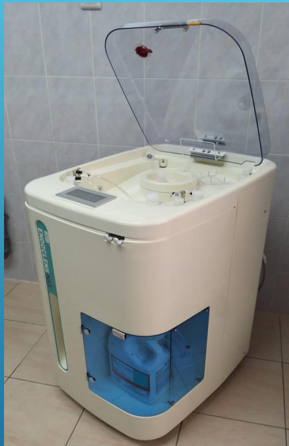
Моечно- дезинфицирующий автоматический репроцессор для гибких эндоскопов