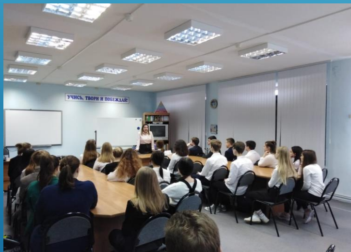
Беседа с выпускниками МАОУ «СОШ № 40»