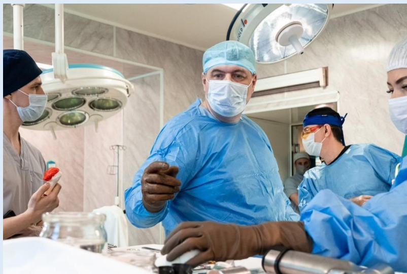
Операция по замене плечевого сустава

Врачи травматолого-ортопедического отделения № 2 Клиник СамГМУ совместно с коллегами из Нижнего Новгорода впервые в регионе выполнили операцию эндопротезирования плечевого сустава с использованием индивидуального керамического эндопротеза. Операцию провели 59-летнему пациенту с артрозом плечевого сустава третьей стадии.