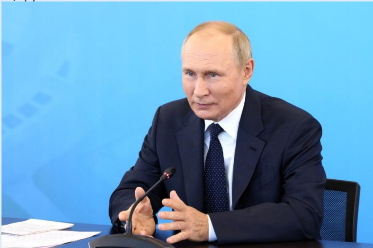
Ректор принял участие в совещании с президентом РФ Владимиром Путиным в рамках реализации университетом федеральной программы Передовые инженерные школы