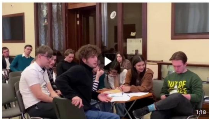
Дебаты «Идеология радикальных организаций» 1 888 просмотров

В рамках дебатов можно: развенчивать мифы, декларируемые представителями радикальных идеологий для вербовки; развивать навыки критического мышления и ведения дискуссии; формировать в целом антитеррористическое сознание и активную гражданскую позицию. Рекомендуется для мероприятия вовлекать не более 20 человек (см. рисунок 5).