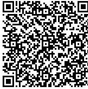
Рисунок 7 — Сценарий тематической викторины с примерами вопросов

В каждом из перечисленных мероприятий важно отслеживать активность участников, высказываемыми ими мнения, их настрой в целом. На таких мероприятиях необходимо присутствие психолога для фиксации активности и оценки их поведения.