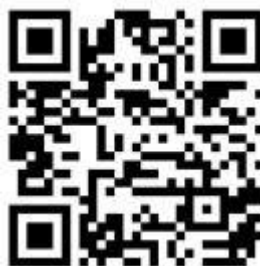
Рисунок 6 — Рекомендации по проведению кинопоказов в профилактике

Среди фильмов по тематике противодействия терроризму можно использовать следующие фильмы: «Беслан. Память» (Россия, 2014 г., возрастное ограничение: 12+), «Кавказский пленник» (Россия, 1996 г., возрастное ограничение: 18+), «Я не террорист» (Узбекистан, 2021 г., возрастное ограничение: 18+), «Отель Мумбаи: противостояние» (США, Австралия, 2018 г., возрастное ограничение: 18+) и т.д.