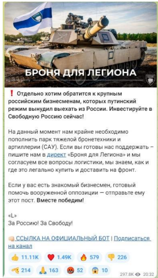
Рисунок 3 — Скриншот телеграм-канала легиона «Свобода России» с призывом к финансированию

Важно подчеркнуть, что помимо собственно пропаганды и распространения идеологии террористических организаций, а также вовлечения в деятельность террористических организаций существует еще одна угроза террористического характера — ложные сообщения о готовящемся террористическом акте. Только за 2021 год зафиксировано более 4,5 тысяч ложных сообщений о готовящихся терактах на объектах социальной инфраструктуры. Это может быть хулиганство, злой умысел, специфическое чувство юмора, желание проверить качество работы правоохранительных органов или антитеррористическую защищенность объекта и др. Во всех вышеперечисленных случаях за такой поступок придется нести уголовную ответственность. Ведь злоумышленник нарушает конструктивную деятельность общественных объектов, а правоохранителям приходится задействовать множество средств и сил, чтобы проверить объекты, которые якобы находятся под угрозой. За ложное сообщение о готовящемся теракте правонарушитель может быть наказан либо штрафами – от 200 тысяч рублей и до двух миллионов рублей, либо лишением свободы – от одного года до 10 лет. Ответственность за данный вид правонарушения наступает с 14 лет (статья 207 УК РФ «Заведомо ложное сообщение о акте терроризма»).