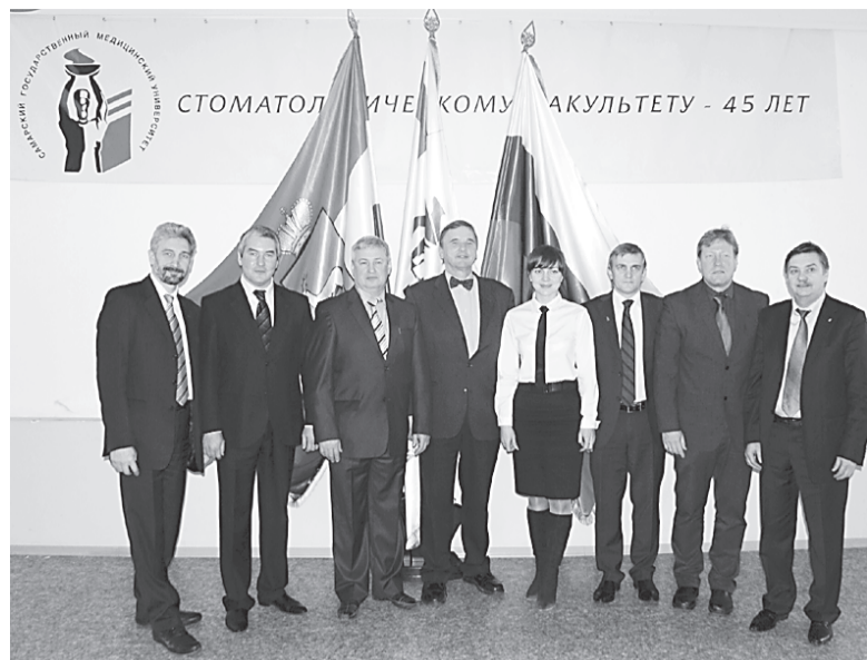
Участники конференции "Безметалловые технологии в стоматологии".