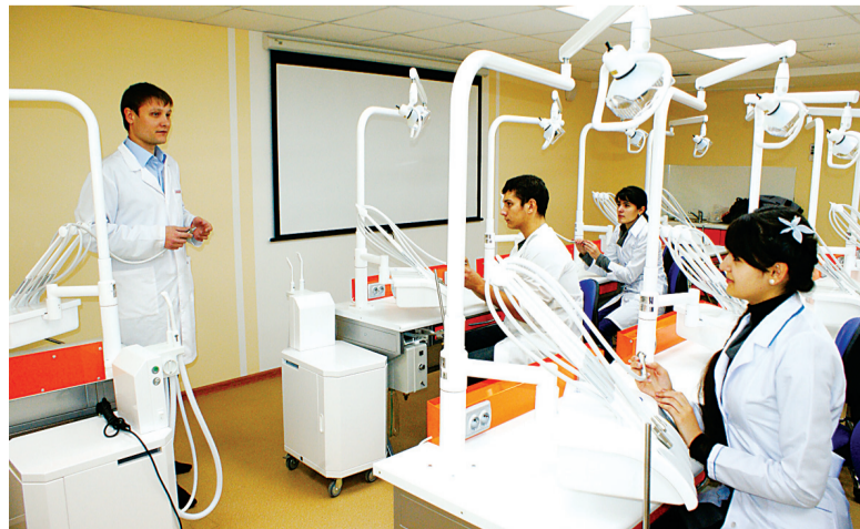
В центре практических навыков для стоматологов.