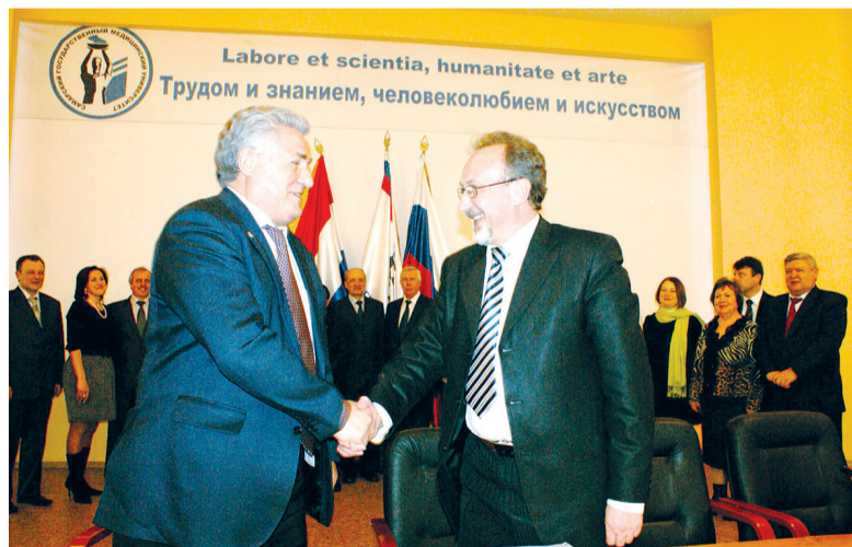
Подписание Коллективного договора.

Важным фактором явилось соблюдение трудового законодательства при приеме на работу и заключении с работником трудового договора. В данном разделе у нас не возникло практически никаких проблем. Мы не уволили ни одного работника по сокращению штатных единиц.