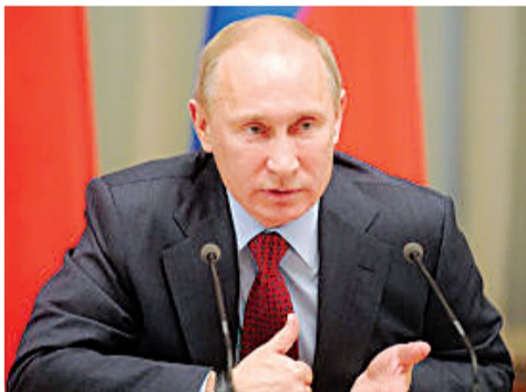
Председатель Правительства В.В. Путин.