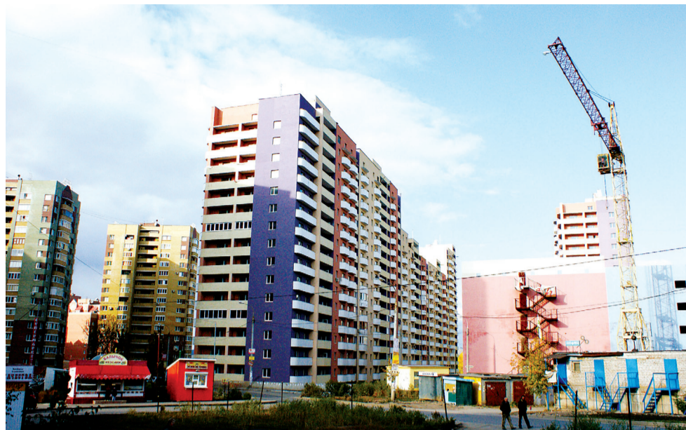
Первый межвузовский дом.

- Качественное образование — это еще и тот самый «социальный лифт», который позволяет самым талантливым и динамичным быстрее добиваться успеха. Но в молодости запас энергии таков, что студенты помимо учебы успевают и подрабатывать, и влюбляться, и интересоваться политикой. Один из молодых участников встречи аспирант Российского государственного гуманитарного универ-