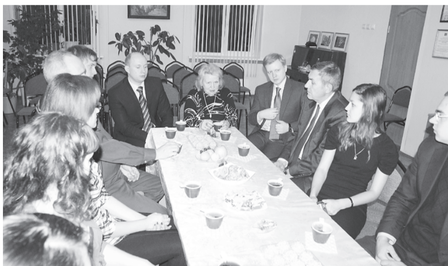
Разговор за чашкой чая на заседании студсовета общежития №5.

- Если честно, вообще даже мыслей нет никаких!